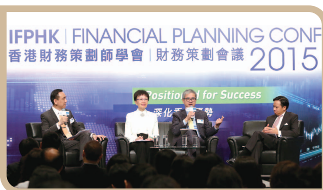
参与由香港财务策划师学会「财务策划会议2015」 之退休策划论坛