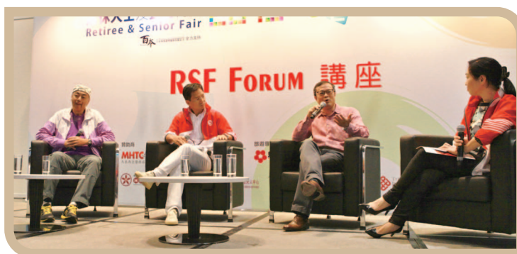
与永隆银行参加「退休人士及长者博览2015」座谈会