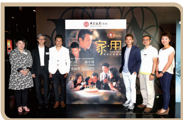
参与由中国银行(香港)举办之微电影 《家·用》放映会