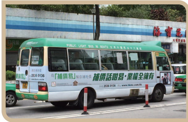
海报和小巴车身广告