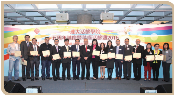
参与由活龄学院举办之「积极活龄周2015」