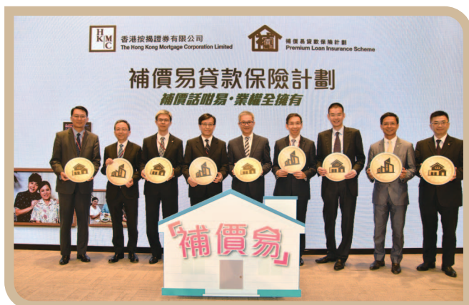
推出「补价易贷款保险计划」