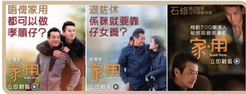
「安老按揭计划」微电影《家·用》首映礼