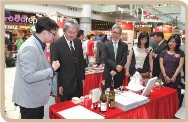
「小型贷款计划-大梦想由小实践」展销会