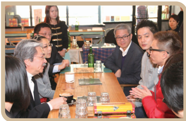
与「小型贷款计划」借款人聚会