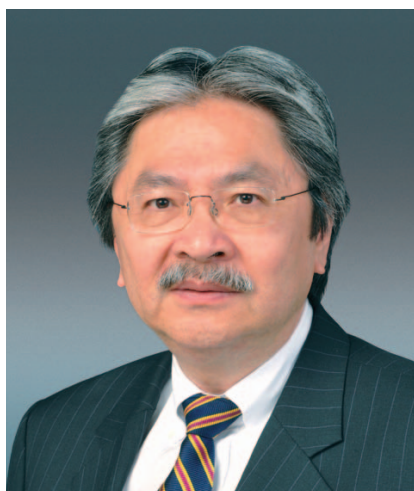
曾俊華先生 , GBM, JP 主席兼執行董事 財政司司長