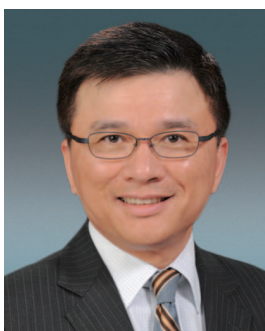
陳家強教授 , GBS, JP 董事 財經事務及庫務局局長