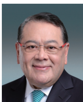
石禮謙先生 , GBS, JP 董事 立法會議員