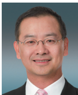
余偉文先生 , JP 執行董事 香港金融管理局副總裁