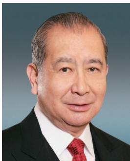
李國寶博士 , GBM, GBS, Hon. LLD (Cantab), JP 董事 (於二零一四年四月七日 退任) 東亞銀行主席兼行政總裁