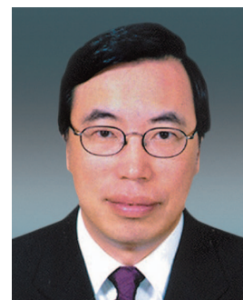
梁君彥先生 , GBS, SBS, JP 董事 立法會議員 新興織造廠有限公司主席