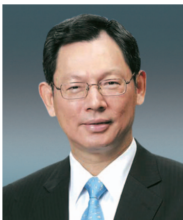
陳德霖先生 , GBS, JP 副主席兼執行董事 香港金融管理局總裁