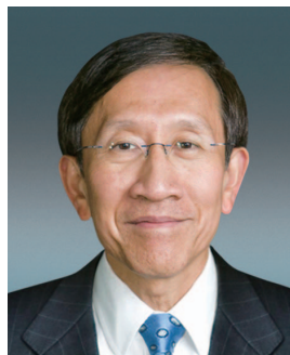
方正先生 , GBS, JP 董事 (於二零一四年四月七日 退任) 香港公開大學校董會主席