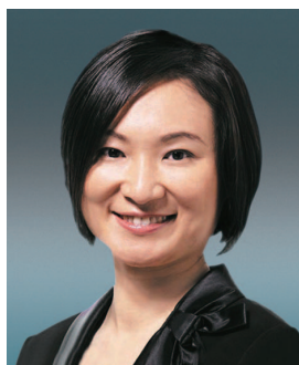
李慧琼女士 , JP 董事 行政會議成員 立法會議員