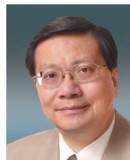
張炳良教授 , GBS, JP 董事 運輸及房屋局局長