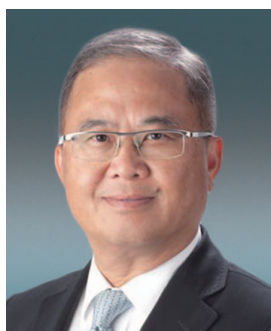
彭醒棠先生 , JP 執行董事 香港金融管理局副總裁