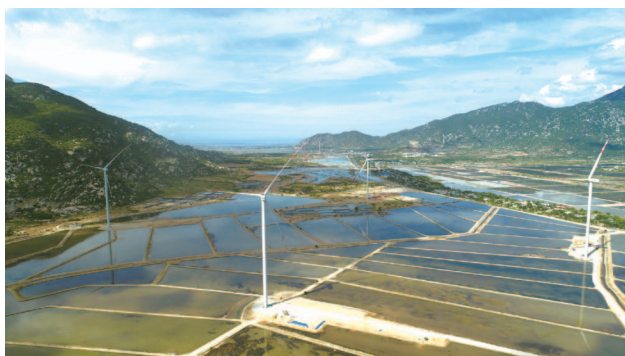
基建融資及證券化業務： 越南寧順省BIM風力發電項目