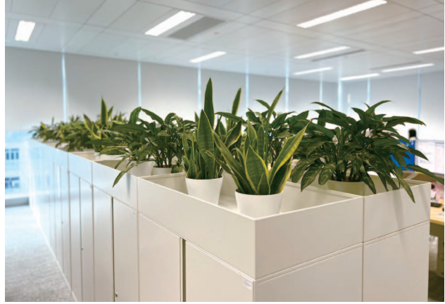
綠色工作間：辦公室內的盆栽