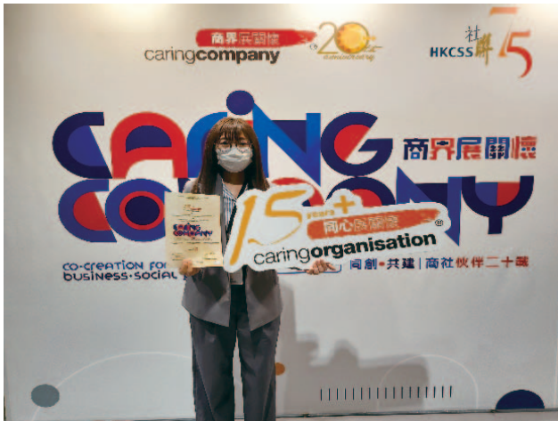
獲頒「同心展關懷」標誌

為表彰本公司對社區的貢獻及其對社會責任的承諾，本公司自二零零八年起獲香港社會服務聯會頒發「商界展關懷」計劃下「同心展關懷」標誌。